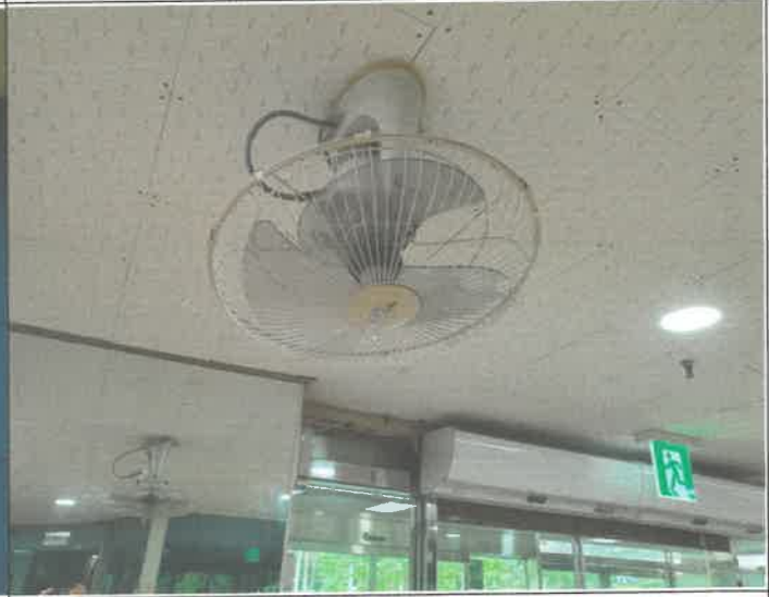
수영장 로비 선풍기 날개 파손 교체