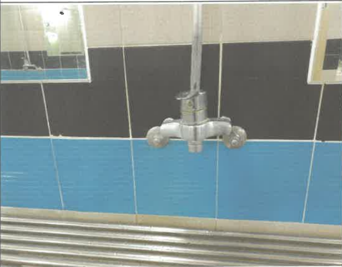
수영장 남자 샤워장 수전 누수 조치 완료