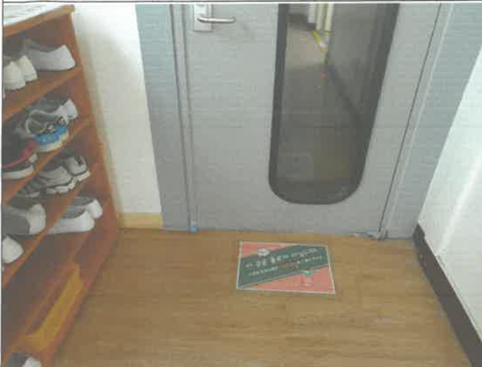
지하 소체육관 출입 방음문 하단 파손 조치