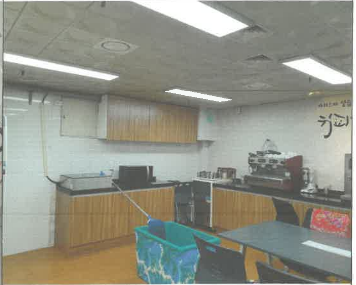
지하 커피공방 천장 누수 응급조치