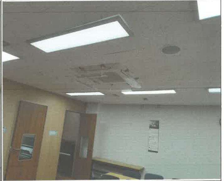
3층 아마데우스 실 등기구 1기 교체 설치