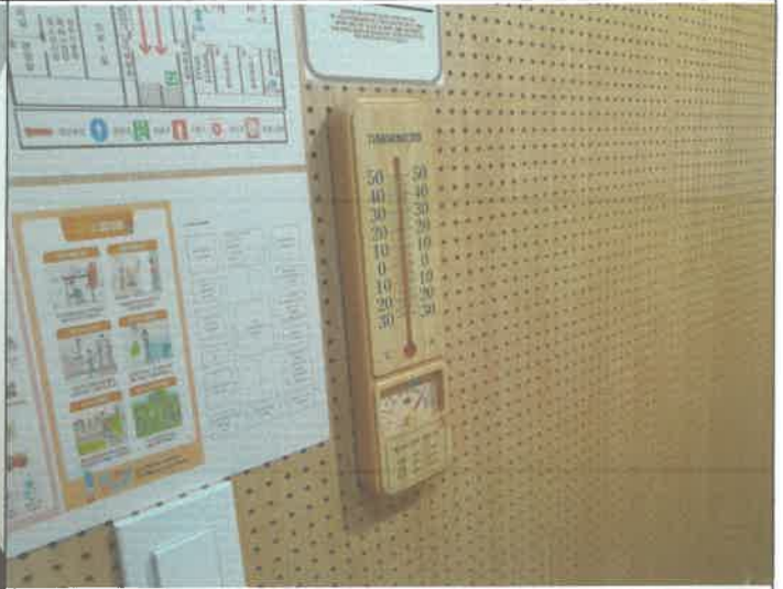
3층 드럼 1. 2.실 아마데우스실 온도계 교체 부착