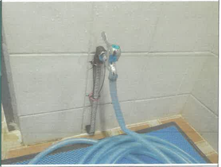
수영장 내 여자 샤워실 계단 입구 쪽 벽 수도꼭지 누수로 인한 교체