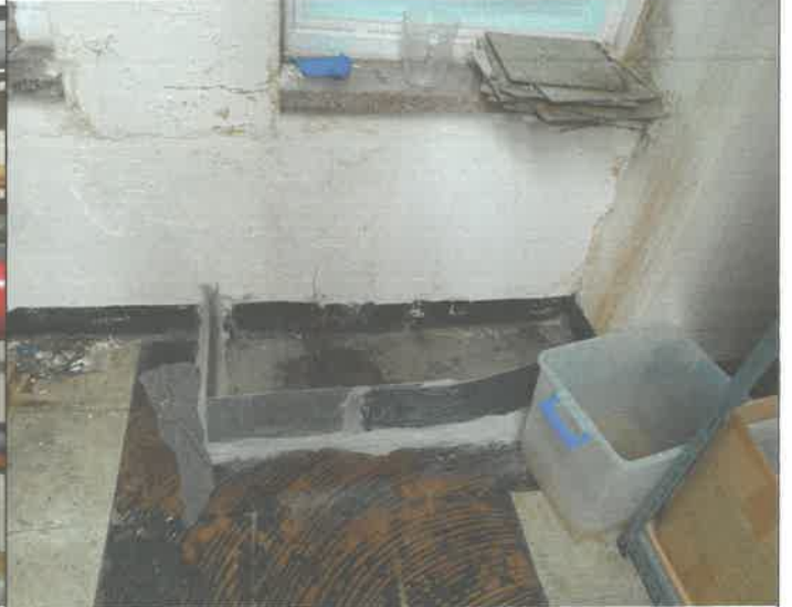
2층 교부제 창고 벽면 우수유입개소 임시 집수정 설치 및 바닥 유입물 처리