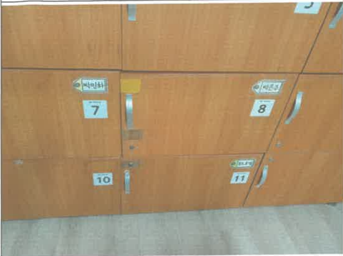
피아노실 사물함 경첩 탈거 되어 제설치