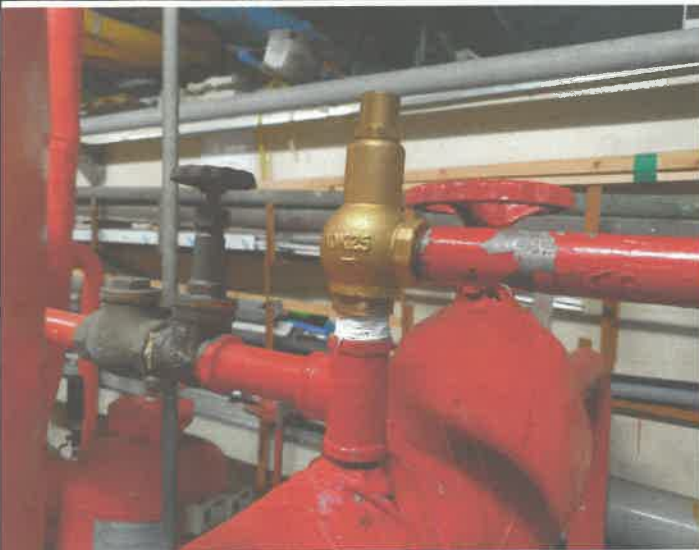
소방 소화전 펌프 릴리프 밸브 교체