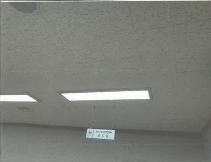
2층 상담복지센터 등기구 교체