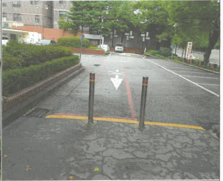
1층 주차장 블라드 파손되어 구매 후 제 설치