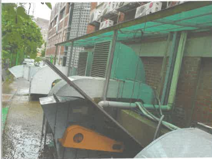
우천의로 인한 우수 배관 누수 웬 모터 보호 차 임시 조치