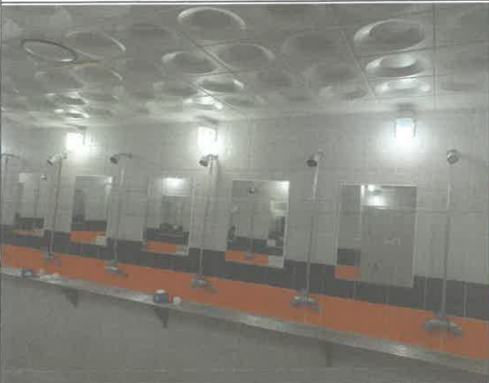
수영장 여자 샤워장 내 벽등 3개소 전구 교체