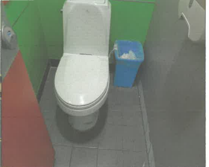
2층 여자 화장실 변기 막힘 통수