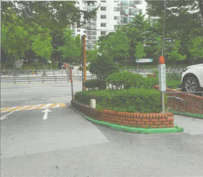
주차장 입구 주차 감지기 전열 정비