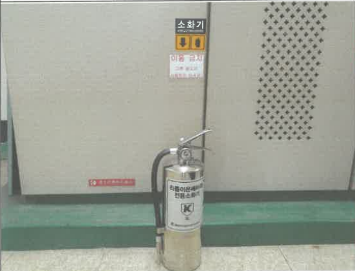
전기실 추진지반 리튬 배터리 전용 소화기 배치