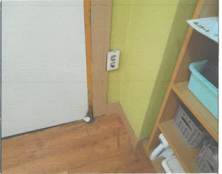
1층 방과후 교실 콘셋트 타락 보수