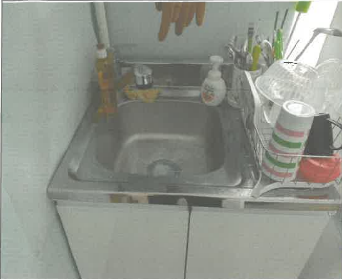
2층 상담실 개수대 통수