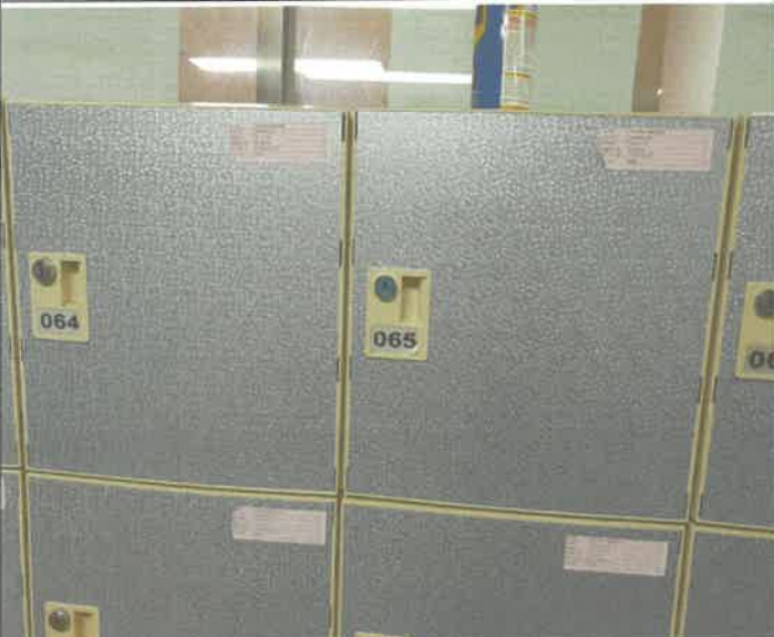
수영장 임대 락카룸 사물함 키 1개소 교체