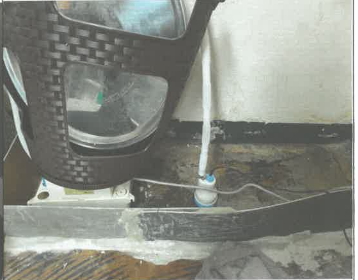
2층 창고 소형 수중 펌프 추가 설치