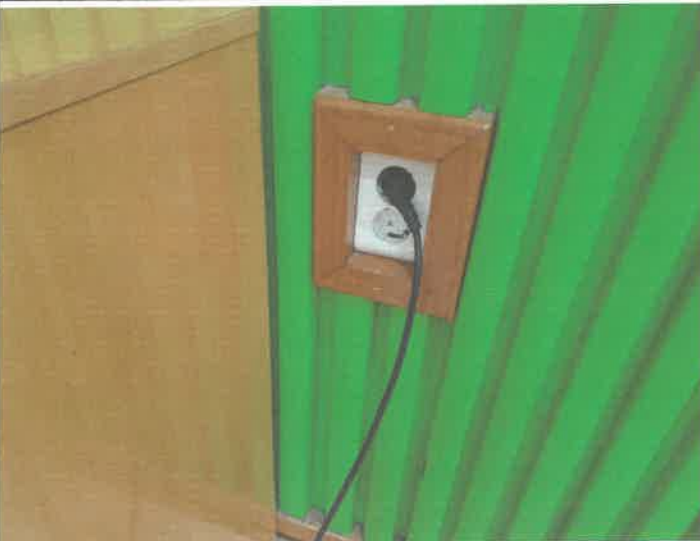
대체육관 벽콘셋트 파손 교체 설치