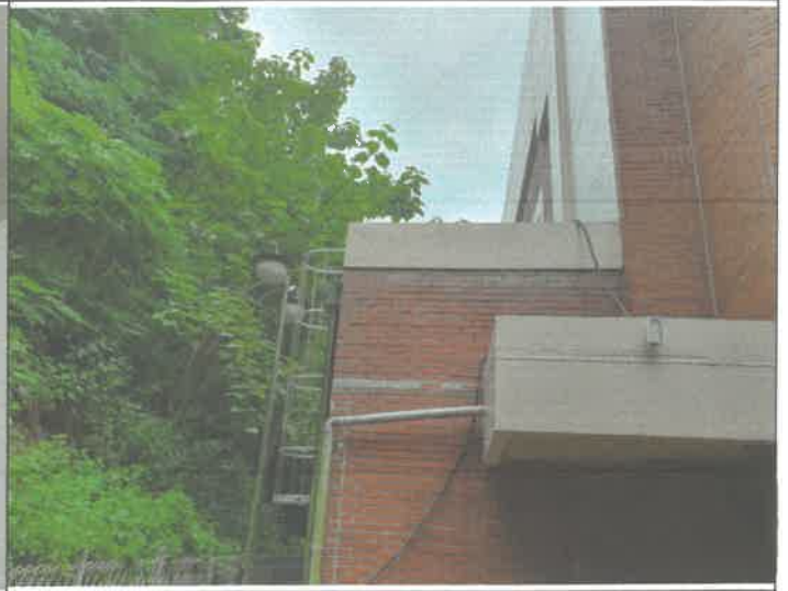
체육관 준비실 천장 낙엽제거