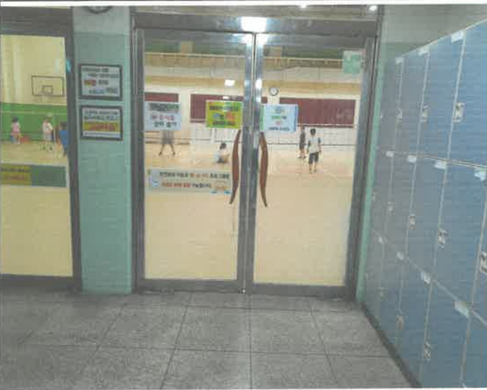
대체육관 출입 강화문 하부힌지 해체 교정 설치