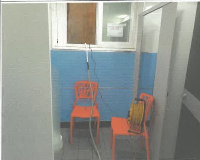
지하 1층 남자 화장실 창문 뒤 트렌치 물 트레인