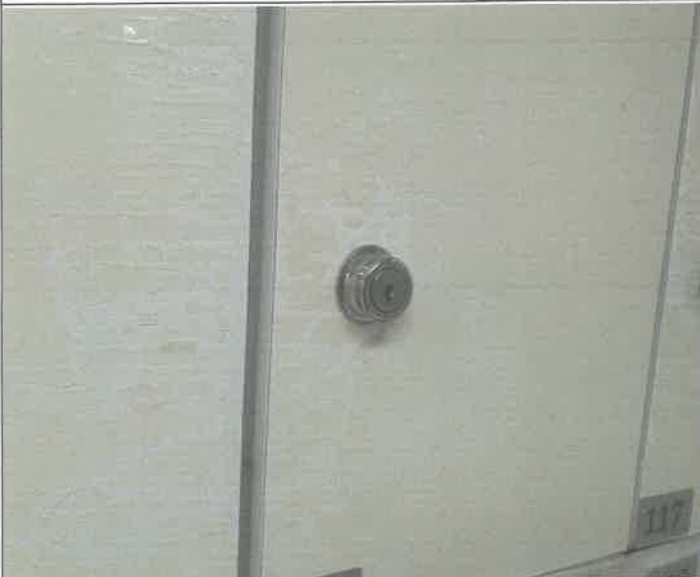
수영장 여자 탈의실 락카 문짝 1개소 수리