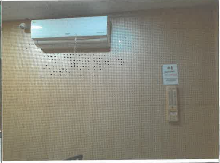
드럼실A 온도계 이전