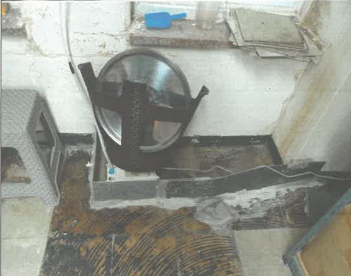
22층 창고 천장 누수 물받이 트렌치 물 드레인 및 에어컨 드레인 펌프 설치