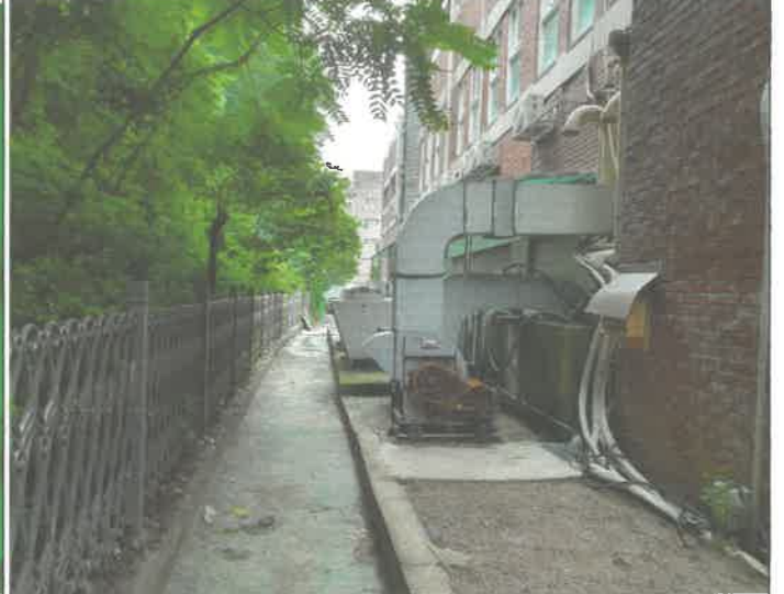
건물 후면 각종배기팬 점검 및 구리스 주입