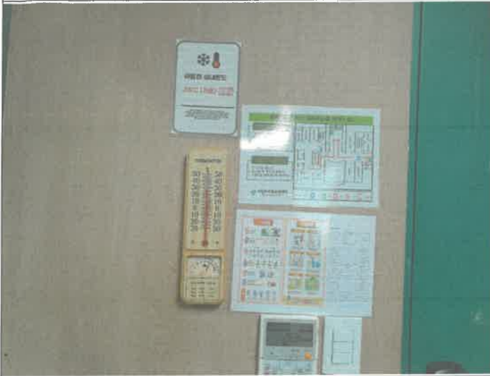
각실 온도계 점검 및 교체