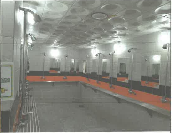
수영장 여자 샤워실 전구 2개소 교체