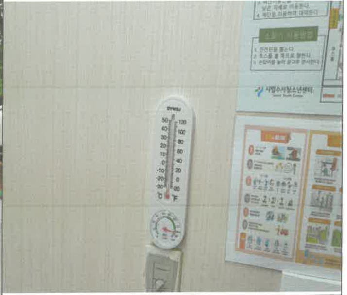
총별 미설치 프로그램실 온도계 설치