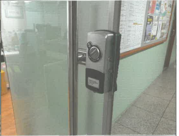
1층 평생 교육팀 출입문 도어락 파손 수리