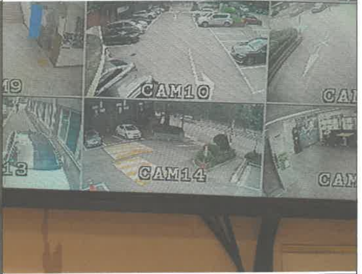
주차장 출입구 CCTV 동축 케이블 커넥터 교체 설치 정상 작동