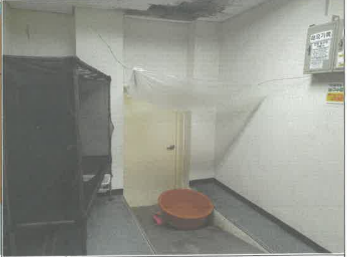
대체육관 준비실 입구 물 받아 설치