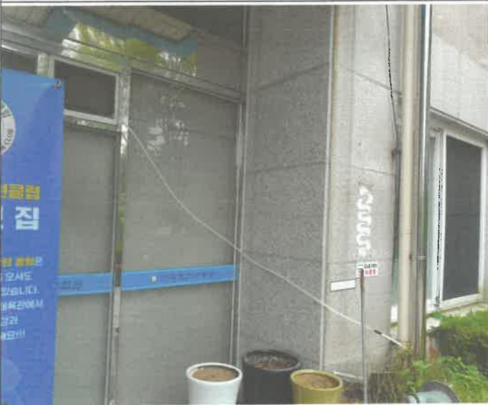
1층 로비 에어컨 응축수 배출관 외부 유도설치