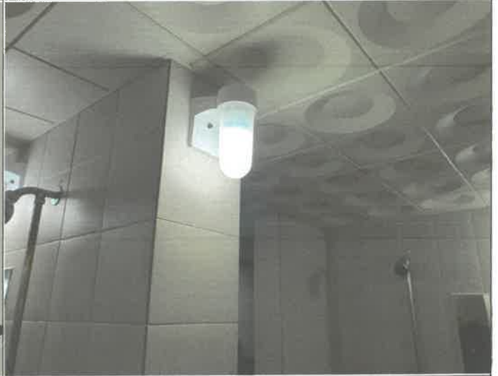
수영장 남자 샤워장 내 전구 1개소 교체