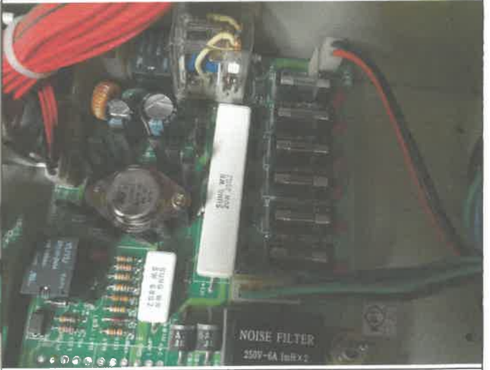
화재 수신기 퓨즈 교체