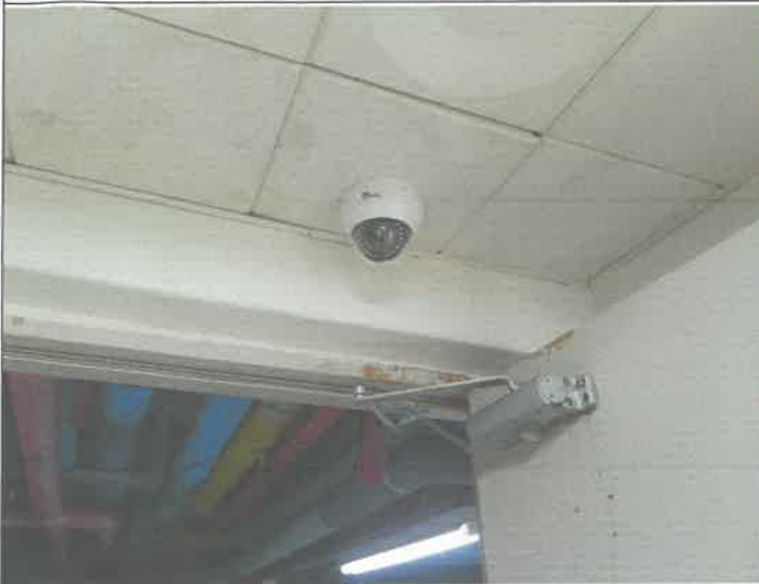
지하 2층 수영장 출입구 CCTV 카메라 적외선 LED 오작동 점검 수리